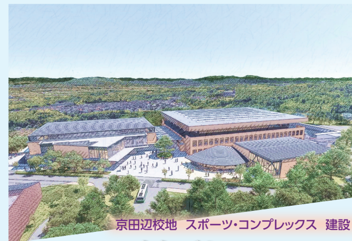
京田辺校地 スポーツ・コンプレックス 建設