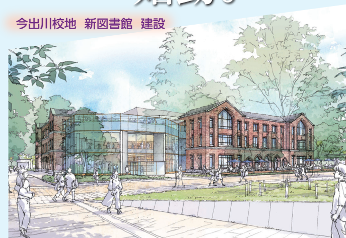
今出川校地 新図書館 建設